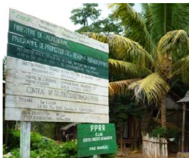
Panneau du PPRR devant le CAM d'Anivorano-Est

La commune a pu bénéficier des activités de développement rural mises en place par le PPRR depuis 2009. Comme l'exprime Madame Le Maire, « Le PPRR a impulsé le développement de notre commune : d'une part, nous avons bénéficié d'infrastructures de base et d'autre part, le PPRR appuie sur le long terme nos principales filières agricoles. »