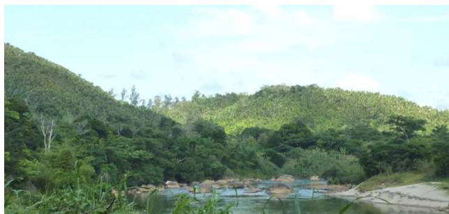
Rives du fleuve Rianila, Fokontany de Sandraka, C.Lamouche 2011

Se situant sur la côte est de Madagascar, elle est caractérisée par un climat « tropical tempéré » et un relief de plaines littorales et des collines. Ce climat est favorable à toute gamme de produits agricoles destinés à l'exportation tel que les litchis, le café, le girofle qui ont été fortement exploités lors de la période de colonisation du pays. En outre, déjà du temps des rois Merina, la commune se trouvait être un lieu d'escale sur le trajet Antananarivo- Tamatave.