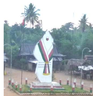
Place principale d'Anivorano-Est, C. Lamouche 2011

Celle-ci a très peu d'activités génératrices de revenus. Comme le raconte Madame Le Maire, « Ce sont les ristournes obtenues lors de la commercialisation des produits agricoles, qui représentent la majeure partie des revenus de la commune . Théoriquement, à cela doit s'ajouter les droits relatifs aux services administratifs, les taxes sur la propriété foncière et la délivrance des certificats fonciers. Or, une majorité de la population n'est pas encore en règle à ce jour. »