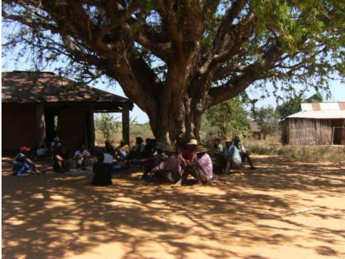
Au pied du grand tamarinier