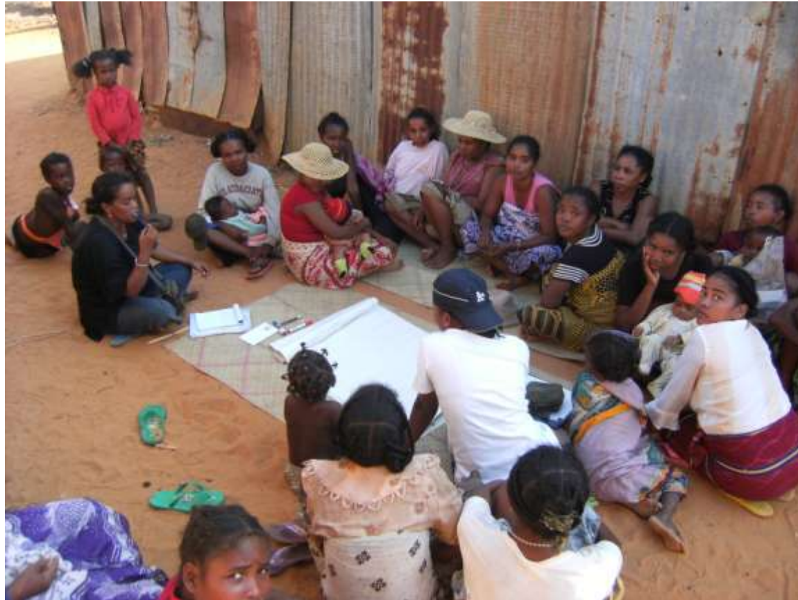
Les femmes discutent