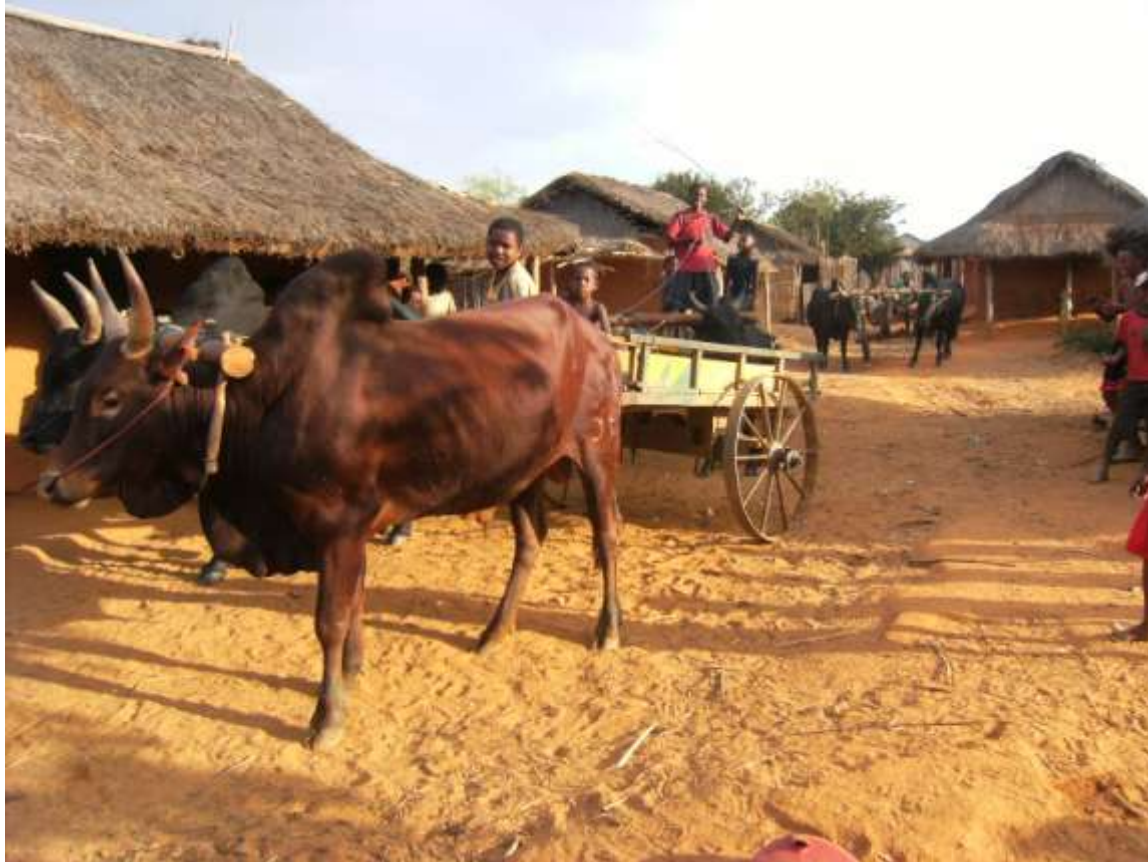
La vie au quartier des migrants