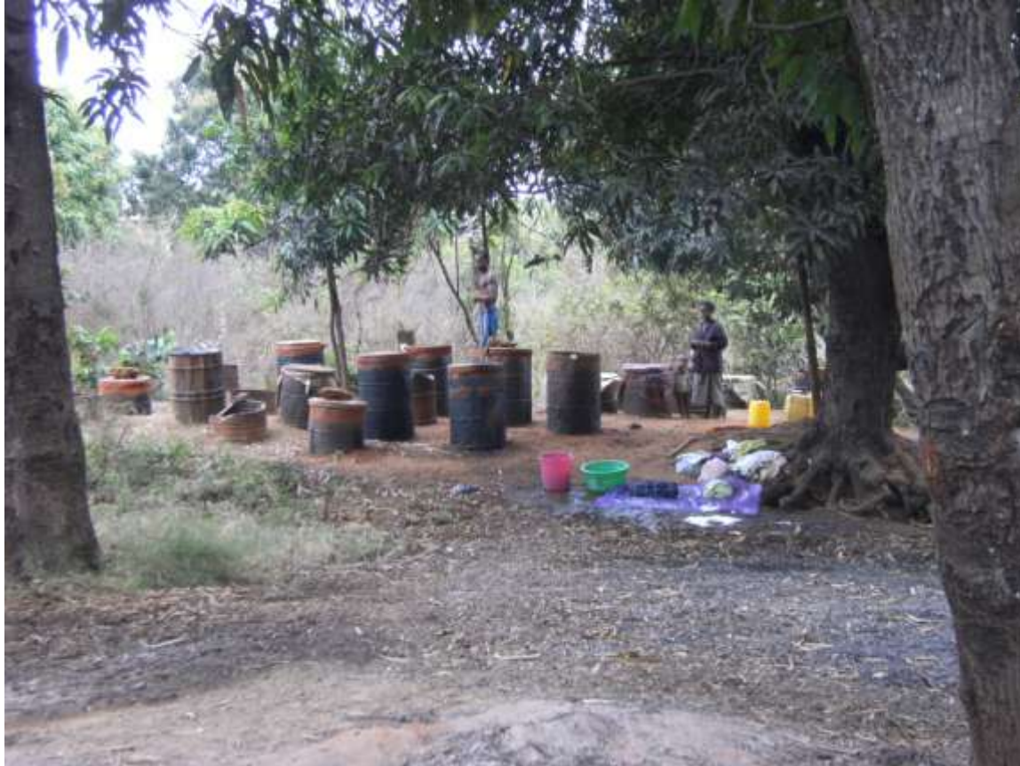
La fabrique d'alcool, une grande source de revenu