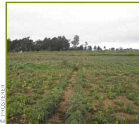
Ambohijafy Imeritsiatosika: Tanety efa kotra nefa azo volena indray ary voaaro amin'ny fikaohan'ny riaka