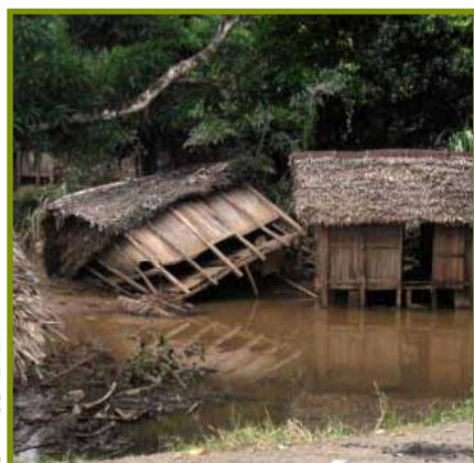
Trano ravan'ny rivodoza Bingiza