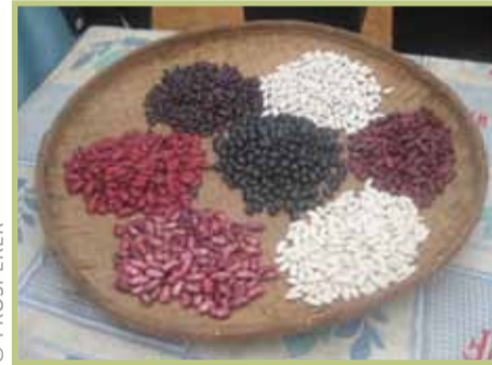
Ireo karazana masomboly tsaramaso namatsian'ny PARECAM ireo mpamboly

Nirindra tsara tokoa ny fiaraha-miasa satria samy nanana ny andraikiny ny tsirairay : ny PARECAM no mpanohana ara-bola, ny FOFIFA no niantoka ny fampitana ny fahalalana ho an'ireo Mpamokatra, ny AMADEA no mpiahy mivantana ireo Mpamokatra eo amin'ny lafiny fandaminana rehetra sy fifantenana ireo mpamboly ho matianina, ny SOC no mitily sy manome alalana ny fampiasana ireo masomboly hovokarina fa tena hanara-penitra tokoa eo amin'ny tsena ary ireo Mpamboly voafantina no hamokatra masomboly fototra.