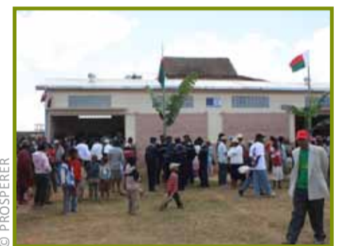
Sompitra iombonana notokanana tao Ambohimiadana