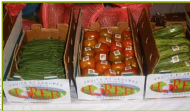
Vokatra manarapenitra: Fenitra HOREB

Taorian'ny fitsidihana nataon'ny mpandrindram-paritry ny PROSPERER Analamanga tany Mayotte ny volana oktobra 2009, niarahany tamin'ireo mpandraharaha tsy miankina amin'ny fanjakana vitsivitsy, no nahatsirihana ny filàna legioma karazany maro tany antoerana. Natao ary ny fikarohana izay ahafahana mampifandray ireo tantsaha mpamokatra teto Analamanga sy ireo mpanjifa tany Mayotte, izay noelanelanin'ireo mpandraharaha ireo izay efa matihanina amin'ny fanondranana. Nananosarotra anefa ny fahitana ireo vokatra ilaina haondrana, na teo amin'ny habetsahany, na teo amin'ny kalitao izay tadiavin'ny mpanjifa.