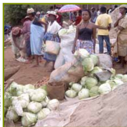
Ny vokatra laisoa teny an-tsena

Farafangana, CARITAS Vaingandrano, CARE Sud Vaingandrano.