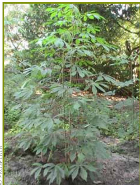
Kajaha natavezina vao 4 volana monja

Ny kajaha dia voly efa fanao mahazatra ary foto-tsakafon'ny olona aty amin'ny faritra. Ny tetikasa PARECAM dia miezaka nanapariaka ny teknika fanatavezana ho an'ny mponina sahirana ho fampiakarana ny vokatra. Ireo teknisiana ao amin'ny INTERAIDE dia nahazo fiofanana mivantana avy amin'ny FOFIFA mikasika io teknika fambolena vaovao io, ka izy ireo indray no nanao ny fampitana sy fizarana ny traikefa amin'ny ekipan'ny DRDR sy ny mpiantokasan'ny tetikasa PARECAM. Ireto farany moa no manao ny fampiofanana ireo mpisitraka, izay natao ny volana febroary