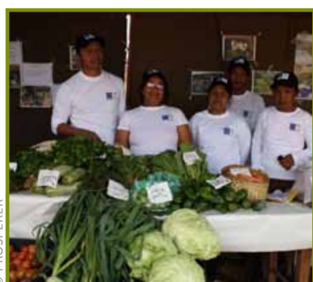
Santionany amin'ireo karazam-bokatra nampirantiana

Ambohimiadana : « ny voly legioma manara-penitra » ary « masomboly voafantina »