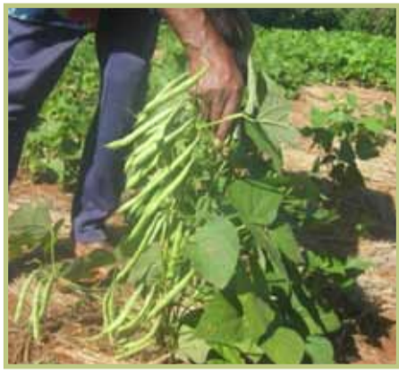
Toy izao ny fahavokaran'ny tsaramaso masomboly manara-penitra

A nisan'ny fanohanana entin'ny Fandaharan'asa PARECAM ihany koa ny fanatsiana ny mpamboly madinika ireo masomboly tsara sy manara-penitra toy ny tsaramaso, katsaka, tongolo, vary, karazan'anana, ny tahona vomanga sy tahona mangahazo.