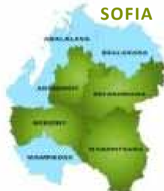
Karazana vary avy amin'ny FOFIFA

Ankoatry ny fotodrafitrasa dia efa atao ao Tanandava ihany koa amin'izao fotoana, izay eo ambany fitarihan'ny PARECAM sy ny FOFIFA, ny fanehoana sy fanandramana voly vary manara-penitra iarahany amin'ireo tantsaha mpikambana ao amin'ny VATSY. Tsy ny hamokatra hohanina ihany no ataon'izy ireo amin'izany fa ny hamokatra masomboly voafantina manara-penitra toy izay hita any Marovoay ihany koa. Fanirina ireo tantsaha ny hampakatra ny voka-bary ho avo roa heny na ho avo telo heny mihintsy aza