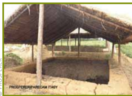
Toerana fanaovana «composte»

A nisany miavaka ary mahasarika mpizahan-tany ny faritra Itasy noho ny toe-tany sy ireo harena voajanahary ao aminy. Tsy lavitra ny renivohitra no misy azy ary malaza noho ireo farihy maro, ny riandranon'i Lily (Chute de la Lily), ny rano miboiboika avy ao anaty tany (geysers ao analavory), sns. Ankoatr'ireo anefa dia toerana lonaka sy mahavokatra tokoa ny faritra. Manana toetr'andro mangatsiaka ny tapany atsinanana (manakaiky ny faritra