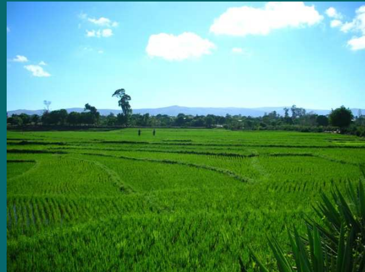
Contre saison riz à Isoanala Betroka