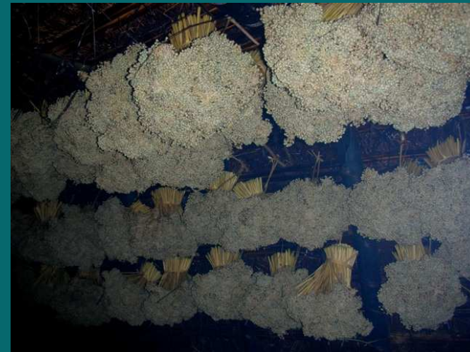
Stockage de semences oignon