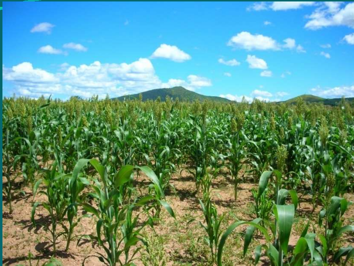
Extension de sorgho à Bekily