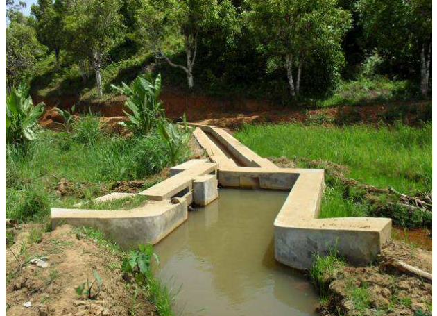
Figure 4 : Régulateur de drain à Sahafamafa, CR Ampasimbe Onibe.