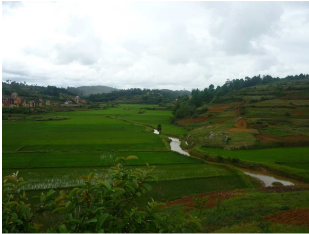
Figure 1 : Périmètre Sahambavy, Manjakadriana, ANALAMANGA