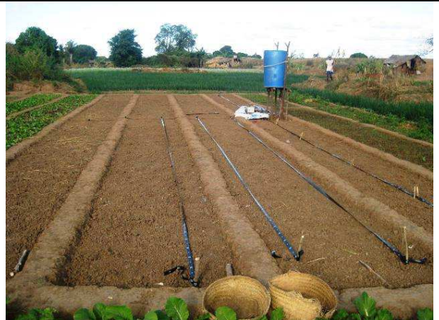
Figure 12 : Site de démonstration du système d'irrigation goutte à goutte, SOFIA