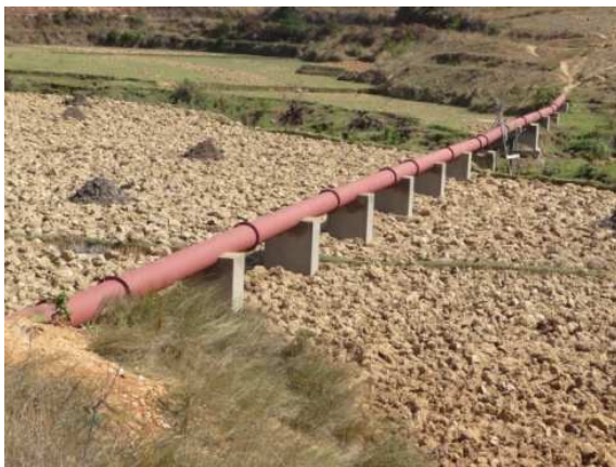
Figure 9 : Siphon du périmètre d'Andrianomby