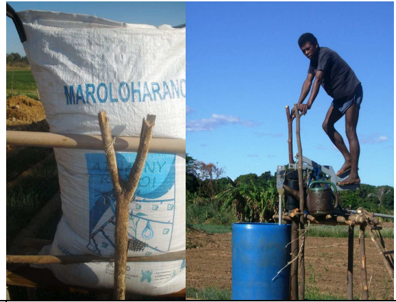
Réservoir et utilisation de la pompe à pédale pour le kit SMI, SOFIA