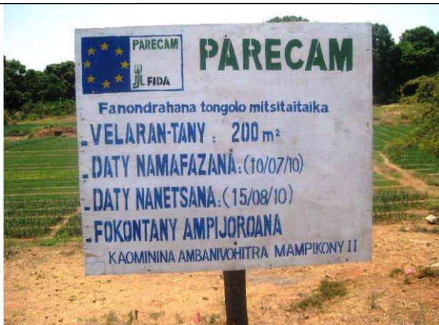
Figure 11 : Site de démonstration de l'irrigation goutte à goutte, SOFIA