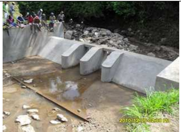
Figure 6 : Barrage nouvellement réhabilitée à Ambohitraivo, ITASY