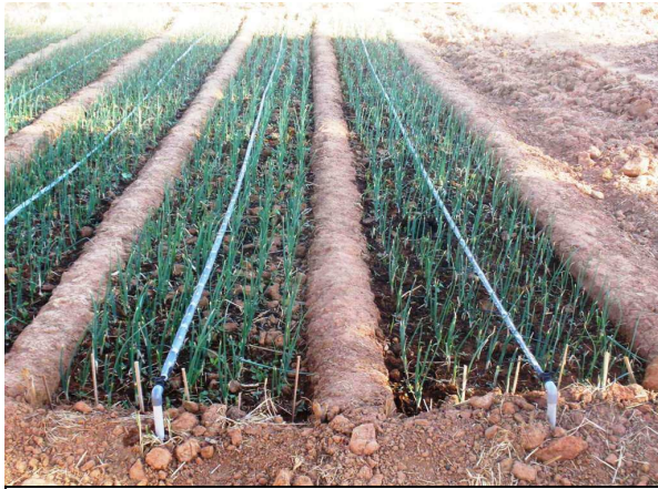
Figure 13 : Réseau de micro-irrigation (kit SCAMPIS), SOFIA

Programme d'appui à la résilience aux crises alimentaires à Madagascar (PARECAM) Mission de supervision du 23 novembre au 17 décembre 2010 – Rapport de supervision n° 3