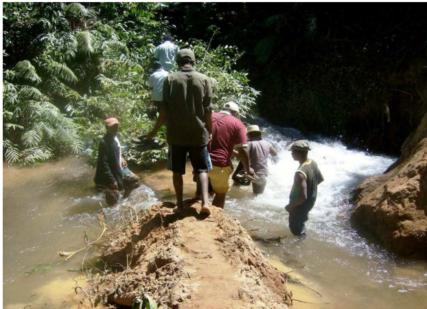
Figure 3 : Visite de lieu des entreprises pour la réhabilitation du réseau d'irrigation de la plaine de TANANDAVA, SOFIA