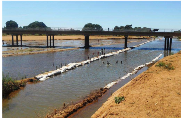
Figure 2 : Renforcement du canal d'adduction d'eau vers Ampijoroana, Mampikony, SOFIA