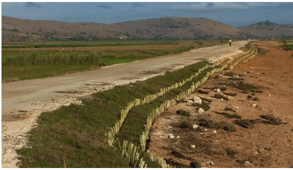
Figure 7 : Protection de digue avec des plantations de vétiver , Amparihitody

Programme d'appui à la résilience aux crises alimentaires à Madagascar (PARECAM) Mission de supervision du 23 novembre au 17 décembre 2010 – Rapport de supervision n° 3