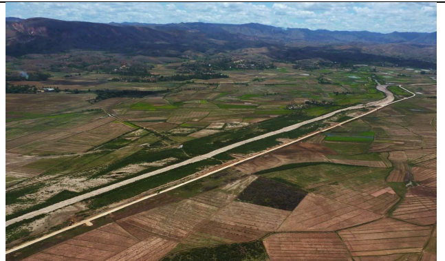
Figure 8 : Dignes et épis terminés dans la vallée Marianina.