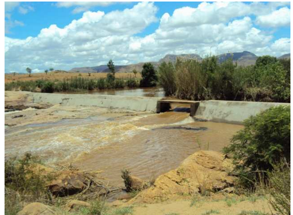
Figure 10 : Barrage Ivahona Betroka