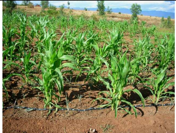
Figure 16 : Micro-irrigatio sur rotation oignon maïs