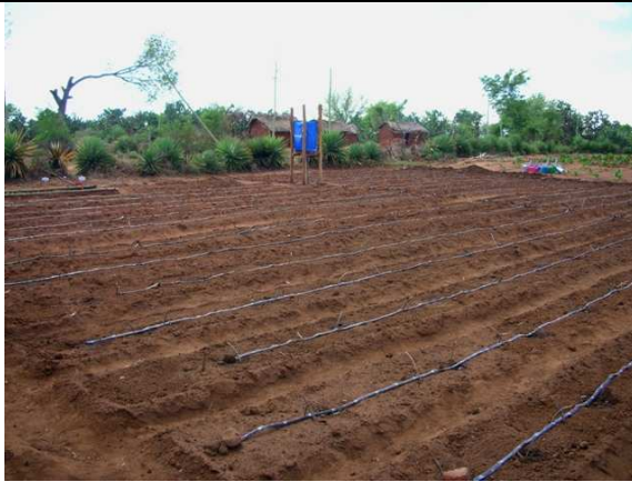
Figure 15 : Réseau de micro-irrigation parcelle maraichère à Tanambao Tsirandran'y Bekily