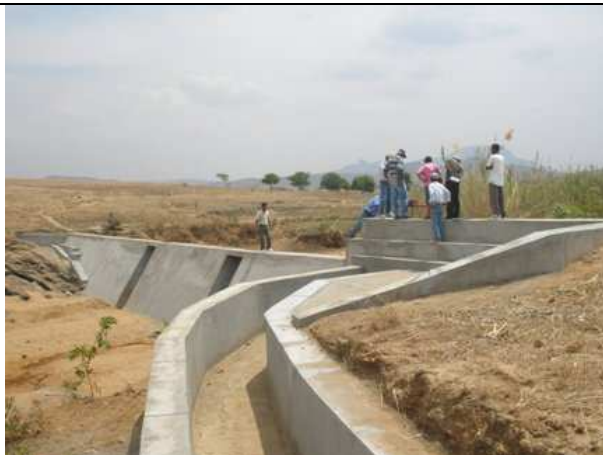
Figure 5 : Barrage de Mahasoa réhabilité dans la Commune Ambinaniroa du District Ambalavao, HAUTE MATSIATRA